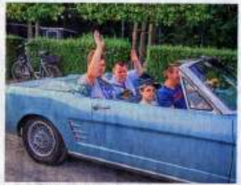
Am Abend ging es wieder mit Cabrios zurück nach Hause.