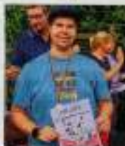
Stolz über die Urkunde und Medaille war nicht nur dieser Teilnehmer.

Ein Höhepunkt des Tages war aber, als mehr als 35 Cabrioles ins Einfeld führen, um die Behinderten mit offenem Verdeck nach Amelsbüren zurückzuführen. Der eine oder andere hatte sich in ein Auto verliebt und versuchte sich dort einen Platz zu sichern. Andere fahren jedes Jahr im gleichen Wagen mit.