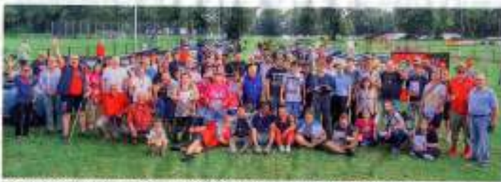
Die Bewohner der Alexianer GmbH verbrachten einen schönen Nachmittag im Boulodrom.