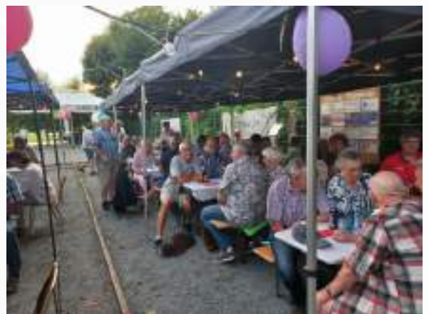
Einige haben auch geboult.