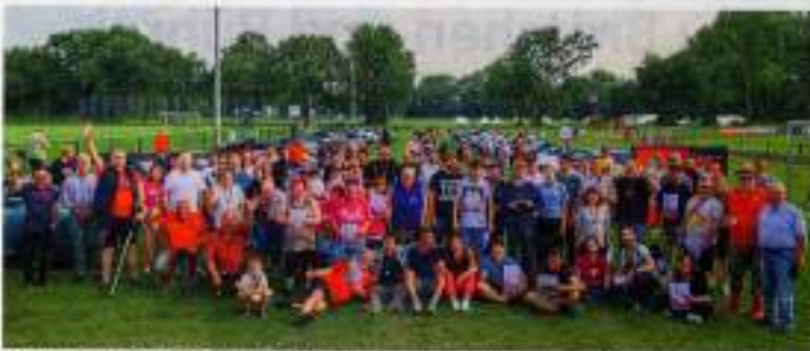
Stadlerde Besucher bei allen Beteiligten. Die Mitglieder des Klack '09 haben zum elften Mal „Einen Tag im Boulodrom“ - Ein Tag mit Menschen mit Behinderung" organisiert.