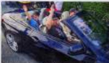
Der Höhepunkt kam zum Schluss im offenen Cabrio wurden die Bewohner der Alexianer nach dem „Tag im Boulodrom“ im Kerveci nach Hause gefahren.